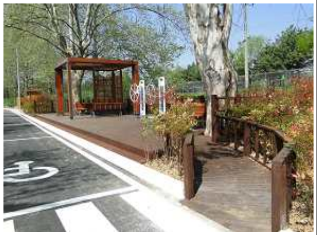
호남지선 북대전 쉼터(논산) : 나무그늘, 운동기구, 자판기, 화장실 등