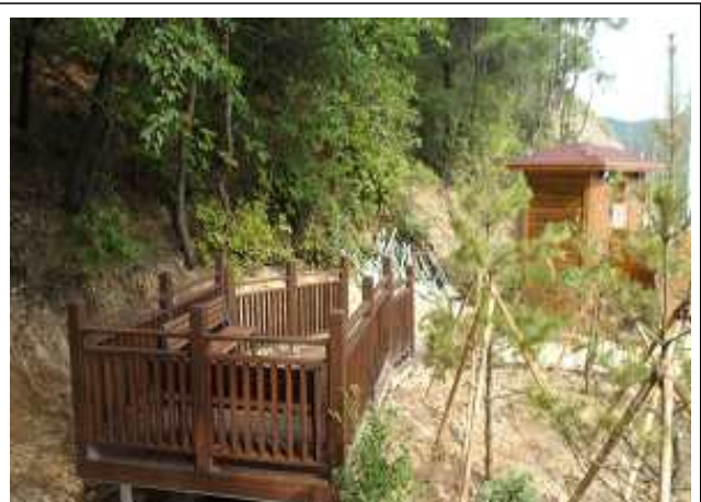
청원상주 상주쉼터(청원) : 절토부 하단 그늘쉼터, 화장실 등