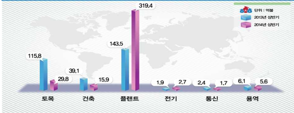
해외건설 수주현황_2014년 상반기 공종별 수주현황