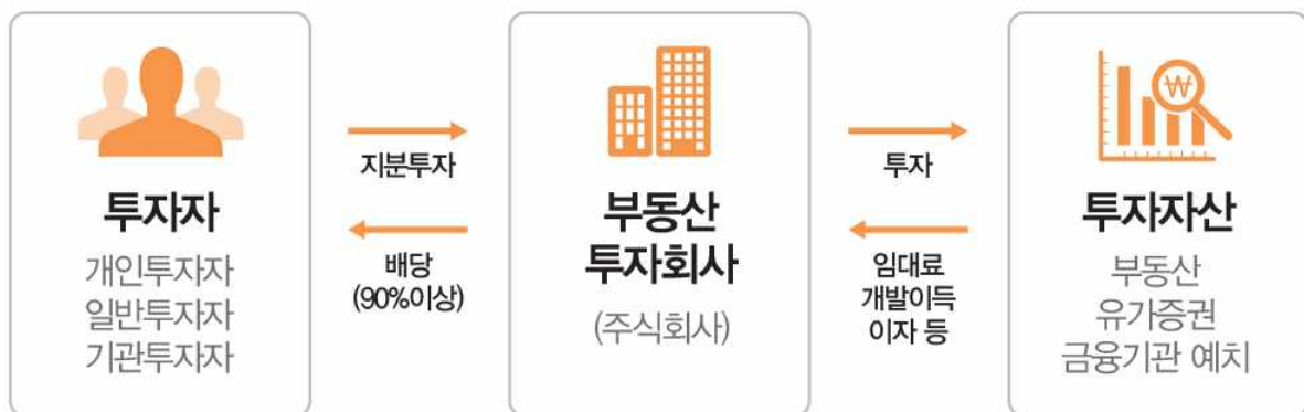
[ 리츠의 기본구조 ]

* 리츠란? 주식회사의 형태로 다수의 투자자로부터 자금을 모아 부동산에 투자하고 수익을 돌려주는 부동산간접투자기구(Real Estate Investment Trusts)