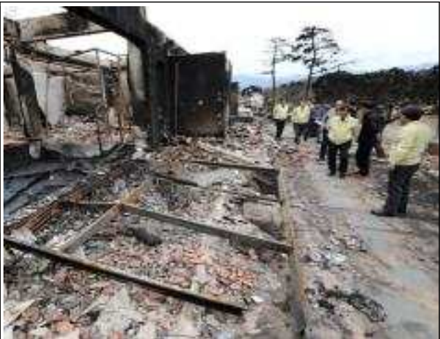
강원도 산불 현장 복구 지원('19.4월)