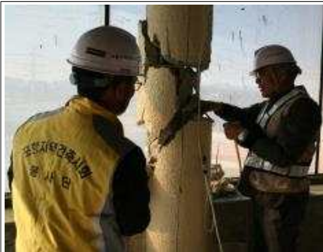
포항 지진 현장 복구 지원('17.11~12월)