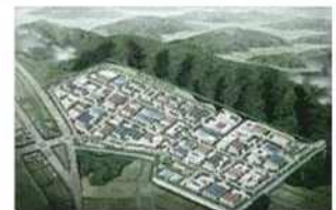
| 맹동산업단지 (418,797㎡)_36개 업체 입주 약 1,200여 명 이상 근무