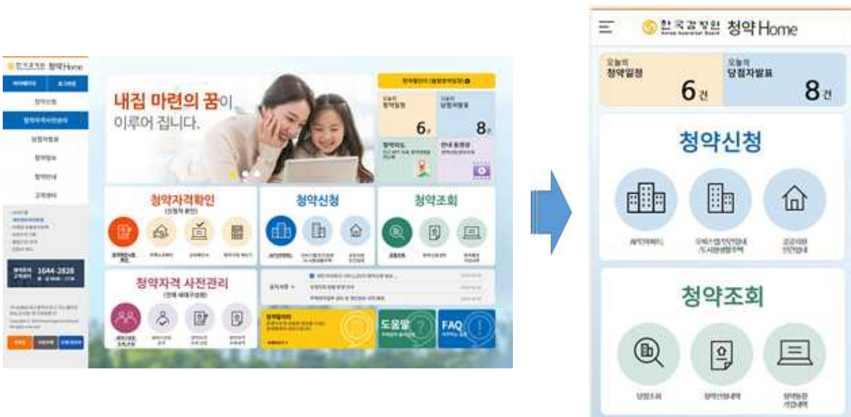
'청약Home' PC 화면