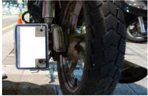
〈이륜자동차-번호판 부착위치 위반〉