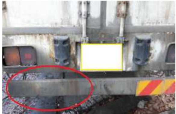
〈화물차-후부 반사지 미부착〉