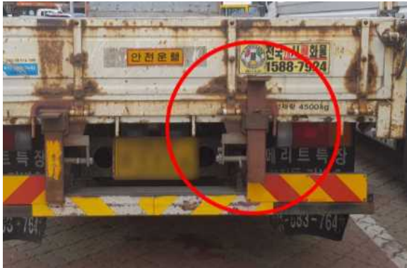
〈화물차-적재함 판스프링 설치〉