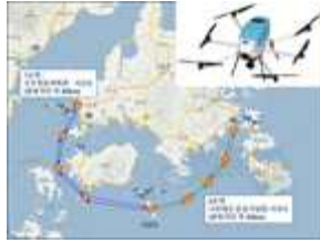
대한항공 (전남 고흥 일대)