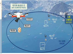
해양드론기술 (부산 영도 일대)