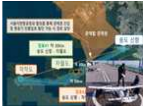
인천국제공항공사 (인천 송도-덕적도)