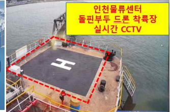
GS칼텍스 (월미도 부두)